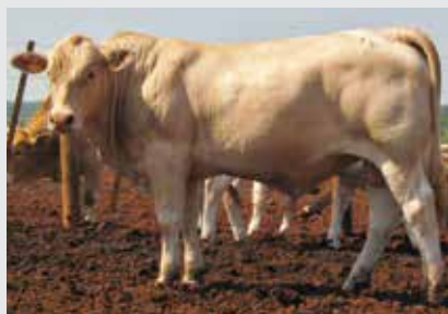
Marino MN da Itamarati