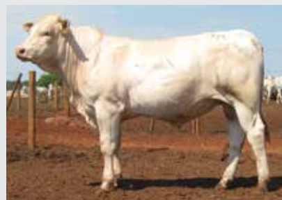
Obio da Ipês