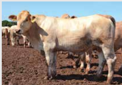
Ozônio da Santa Carolina