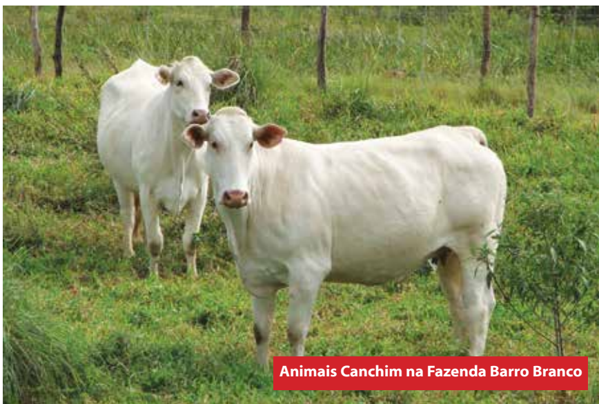
Animais Canchim na Fazenda Barro Branco