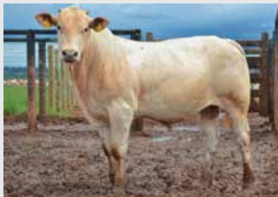
Notse da Itamarati