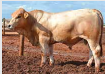
Netuno da Mombaça