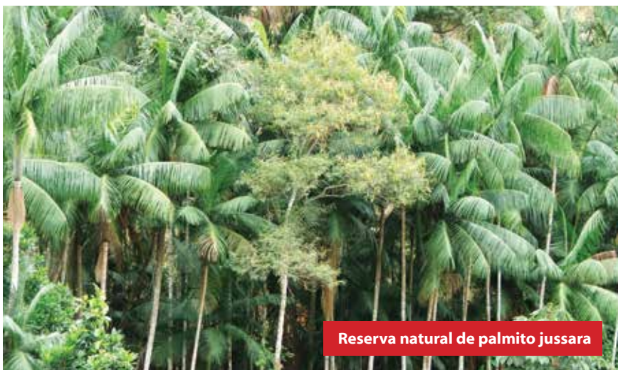
Reserva natural de palmito jussara