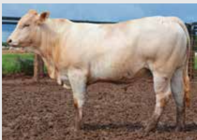
Naipe do Merem